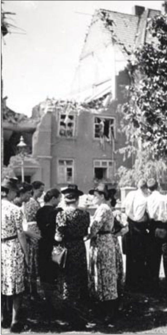
Münster wurde zu 90 Prozent durch Bomben zerstört. Das Bild zeigt Menschen vor der Ruine.

mens-Hospital. Bis heute veröffentlicht Koch Bücher und Artikel, u.a. über seine persönliche Philosophie, die das richtige Verhältnis von Gesundheit und Lebensrhythmus aufgreift.